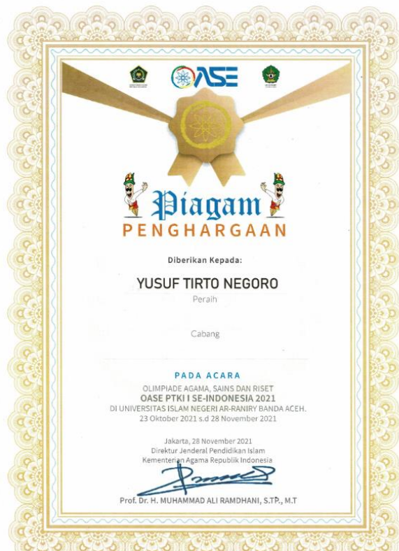
Gambar 2 Sertifikat Penghargaan