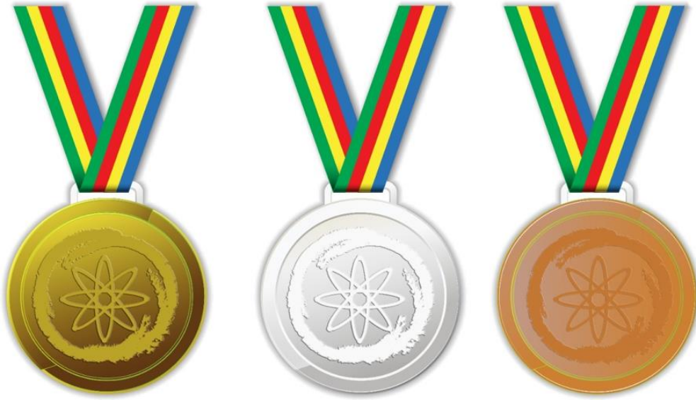
Gambar 1: Contoh Bentuk Mendali